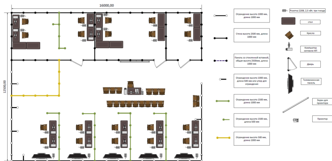
Рисунок 2. Схема конкурсной площадки

Возможная схема конкурсной площадки приведена ниже (см. Рисунок 2. Схема конкурсной площадки).